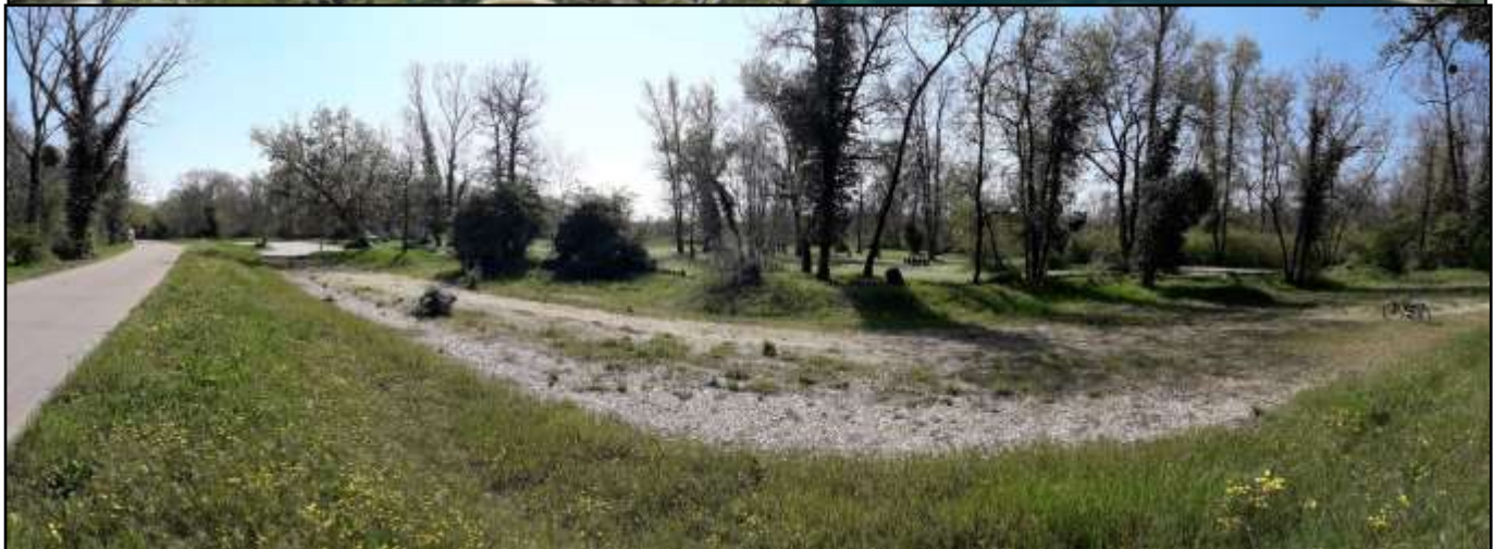
Plateforme de la parcelle AL164, lieu du projet d'implantation du pylône, vue à 180°

Depuis, de nouveaux échanges ont permis d'avancer sur ces différents points, notamment la redevance qui a largement été réévaluée.