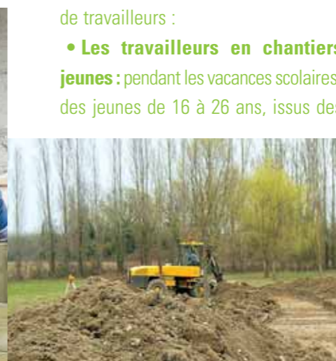
En dehors des travaux de terrassements (photos ci-dessus), le jardin a été réalisé par des jeunes dans le cadre de projets d'insertion. Ici, fabrication des bacs de culture.