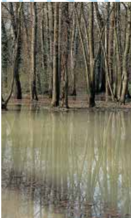
Crue du Rhône en zone équestre