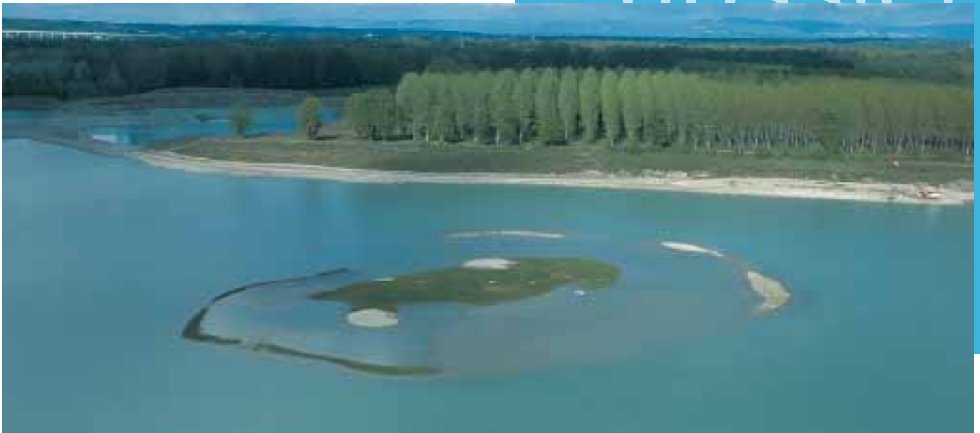
Ile des Allivoz