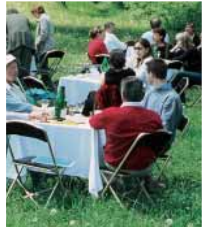
Pique-nique presse sur la Petite Presqu'île

Après cette étape informative, journalistes et responsables du Parc se sont retrouvés autour d'un repas champêtre sur la Petite Presqu'île, au bord du lac des Eaux Bleues, suivi pour ceux qui le souhaitent d'une balade sur les sentiers secrets du parc ou d'activités sportives afin de goûter à la réalité du Parc.