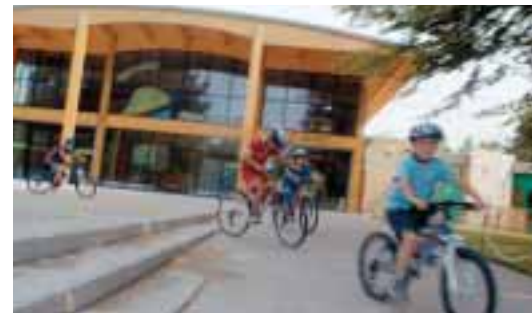
Un accueil "nature" à la mesure du Parc.