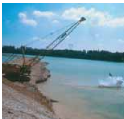
Après 10 années de réaménagement, le Parc Nature offre une grande diversité de paysages.

*Zone Naturelle d'Intérêt Ecologique, Floristique et Faunistique