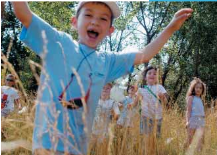
Stage Explorateurs, été 2004