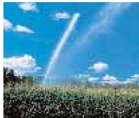
Les parcelles agricoles représentent environ 400 hectares de surface, pour une vingtaine d'exploitants.

loppement durable, les règles instaurées par la charte permettront de trouver un équilibre entre les nécessités économiques des exploitants et les autres vocations du Parc Nature.