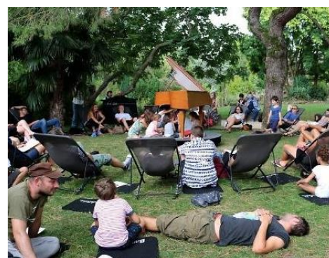
© Photo de gauche à droite : Festijoux / La Compagnie du Deuxième / Bach à Sable

SAMEDI 15 septembre 2018 DE 10H A 18H, A L'Îloz' AU GRAND PARC MIRIBEL JONAGE