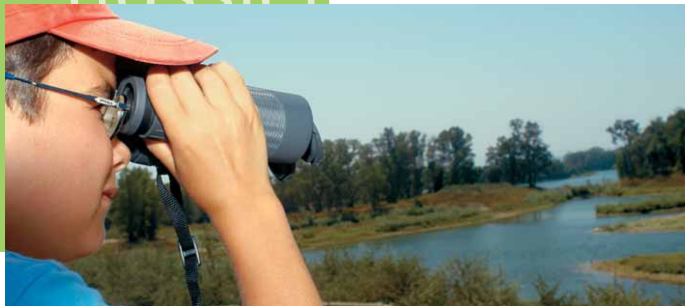
L'observatoire des Grands Vernes