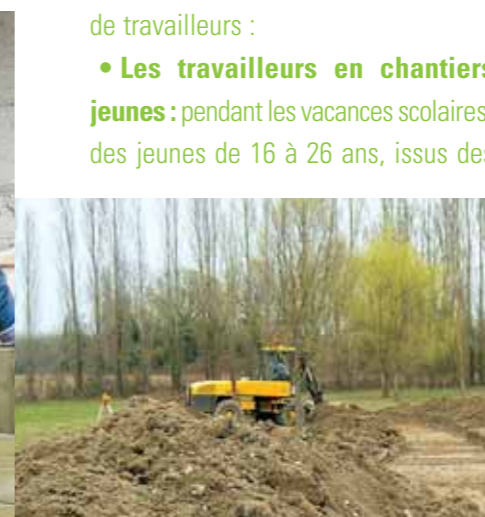
En dehors des travaux de terrassements (photos ci-dessus), le jardin a été réalisé par des jeunes dans le cadre de projets d'insertion. Ici, fabrication des bacs de culture.