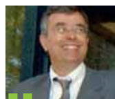
Jean-Jack Queyranne, Président de la région Rhône-Alpes

“ Le parc de Miribel-Jonage est très souvent cité comme un des parcs les plus innovants en matière d'espace périurbain au niveau européen. ”